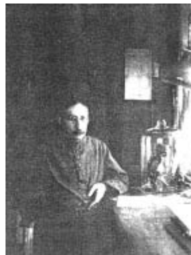
Павел Александрович Флоренский в ссылке. В лаборатории на мерзлотной станции в Сковородино, лето 1934 г.

Он ответил решительным отказом. Но это не облегчило участи ссыльного П.А. Флоренского, отныне его путь лежал на Соловецкие острова, так как в сентябре 1934 г. он был переведен в Соловецкий лагерь особого назначения.