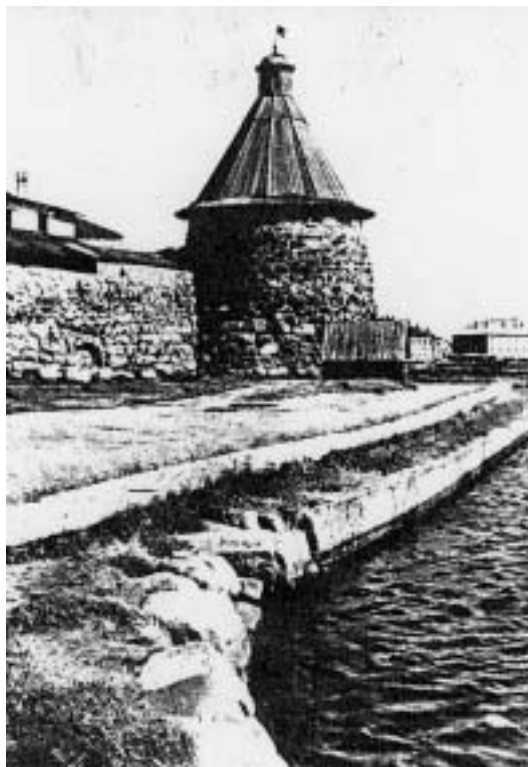
Соловецкий монастырь. Архангельская башня. Конец XVI в.

основан монастырь, который многие столетия служил и местом паломничества, и крепостью, оборонявшей российские рубежи, и местом ссылки и заточения противников официального православия, самодержавной власти, инакомыслящих в условиях большевистского режима. Комплекс Соловецкого монастыря - выдающийся памятник русской архитектуры. Среди многих культовых зданий, хозяйственных и жилых построек особое значение имеют сооружения XVI-XVII вв.: трапезная, пятиглавый Преображенский Собор, церковь Благовещения и др. Территория Соловецкого монастыря окружена мощными стенами, сложенными из необработанного камня. В годы Советской власти монастырь был превращен в Соловецкий лагерь особого назначения, затем преобразован в Соловецкую тюрьму особого назначения.