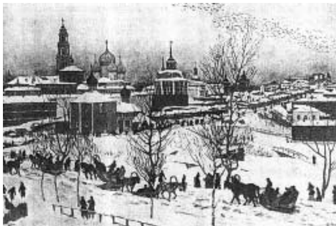
Троицкая Лавра зимой. К.Ф. Юон (открытка)

22 октября 1918 г. он вошел в состав Комиссии по охране памятников искусства и старины Троице-Сергиевой лавры. В результате ее деятельности за короткий срок было описано огромное историко-художественное богатство Лавры и спасено национальное достояние неизмеримой духовной и материальной ценности. В итоге комиссия подготовила проект Декрета "Об обращении в музей историко-художественных ценностей Троице-Сергиевой лавры", подписанного 20 апреля 1920 г. Председателем Совнаркома В.И. Лениным.