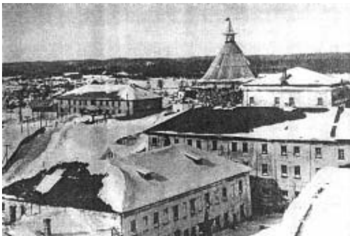
Соловецкий лагерь особого назначения. В центре корпус, где осенью 1937 г. находился П.А. Флоренский (открытка, изданная УСЛОН, 1928 г.)