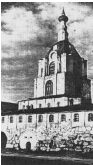
Соловецкий монастырь. Колокольня. 1777 г.

основан монастырь, который многие столетия служил и местом паломничества, и крепостью, оборонявшей российские рубежи, и местом ссылки и заточения противников официального православия, самодержавной власти, инакомыслящих в условиях большевистского режима. Комплекс Соловецкого монастыря - выдающийся памятник русской архитектуры. Среди многих культовых зданий, хозяйственных и жилых построек особое значение имеют сооружения XVI-XVII вв.: трапезная, пятиглавый Преображенский Собор, церковь Благовещения и др. Территория Соловецкого монастыря окружена мощными стенами, сложенными из необработанного камня. В годы Советской власти монастырь был превращен в Соловецкий лагерь особого назначения, затем преобразован в Соловецкую тюрьму особого назначения.