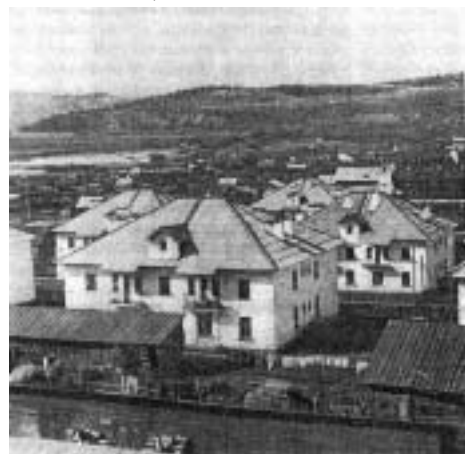
Сковородино – самый северный город Амурской области