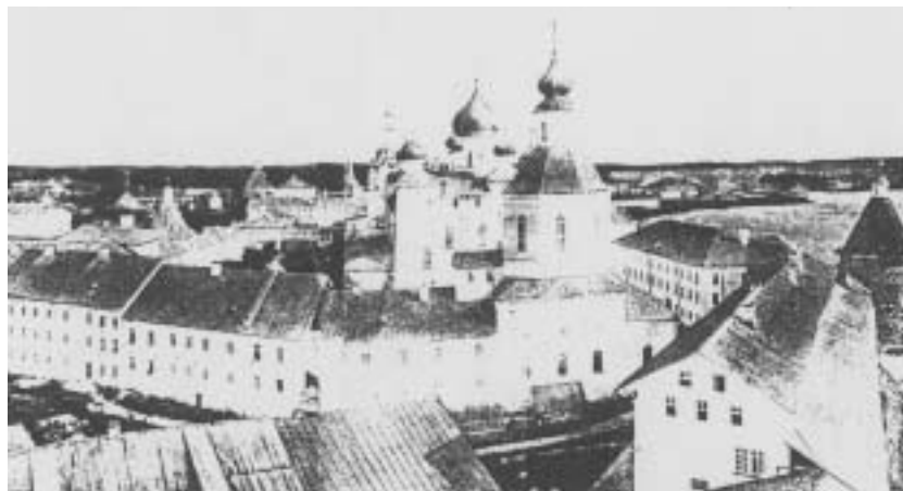
Вид Соловецкого монастыря. Фото конца XIX в.