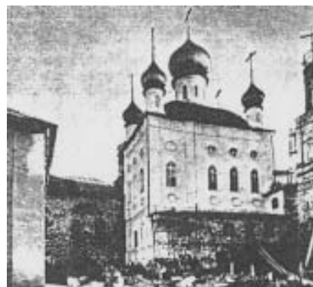
Никольская церковь. 1830-1834 гг.

знать, слишком неумолимо говорили об этом судьба его родины сверху донизу. Можно сказать, что жизнь ему как бы предлагала выбор между Соловками и Парижем, но он избрал... Родину, хотя то были и Соловки, он восхотел до конца разделить судьбу со своим народом. Отец Павел органически не мог и не хотел стать эмигрантом в смысле вольного или невольного отрыва от Родины, и сам он и судьба его есть слава и величие России, хотя вместе с тем и величайшее ее преступление”, - писал о нем Н.С. Булгаков [8].